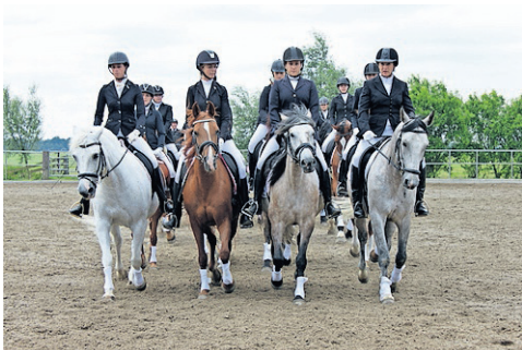
Beeld uit de grote paardencarrousel